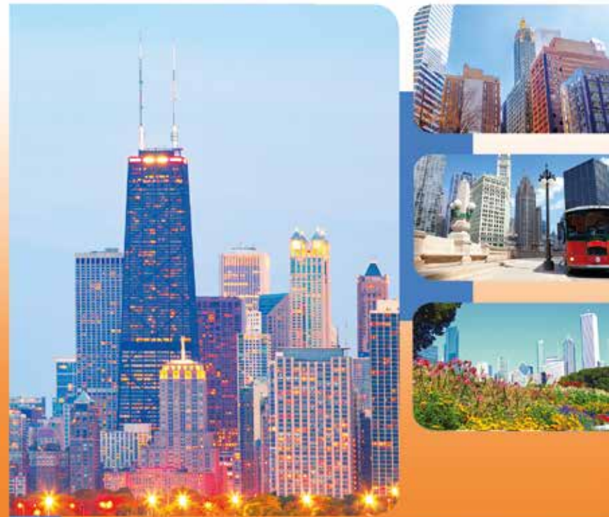
Post-Chicago - Informations présentées à l'ASCO® 2015

Hôtel Pullman Blagnac 2, allée Didier-Daurat 31700 Blagnac Tél. 05 34 56 11 00